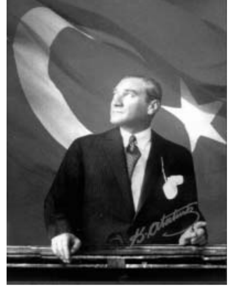
M.K.Atatürk Türkiye Cumhuriyetinin Kurucusu